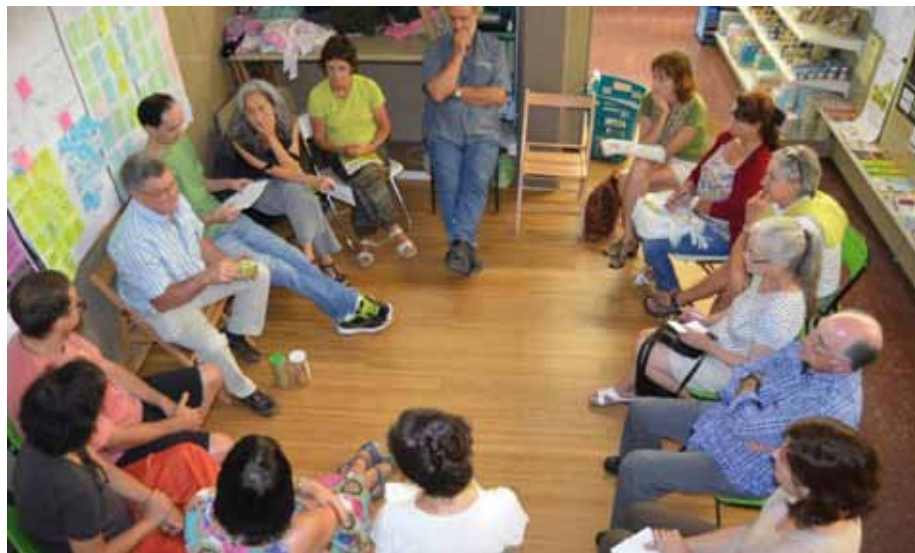
Antolatutako milaka norbanakok indar handia izan dezakete helburu komun baten sustapenean, Ekokontsumo da horren adibide.

El estudio realizado en 2015 sobre los datos de las cinco asociaciones de consumidores de productos ecológicos federados en EKO KONTSUMO arroja datos significativos sobre la evolución del consumo de productos ecológicos en Euskal Herria, y